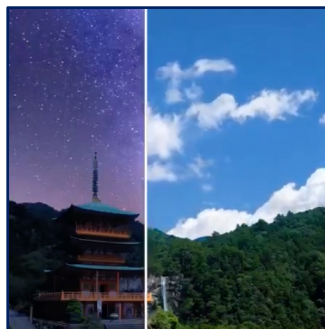
汎用性の高いスクエア型